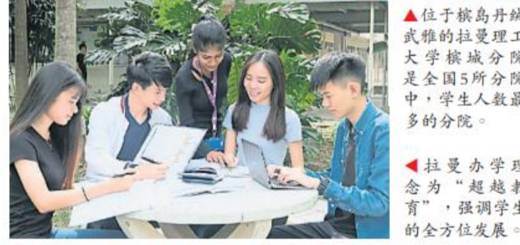
▲位于檳岛丹絨武雅的拉曼理工大学檳城分院是全国5所分院中，学生人数最多的分院。